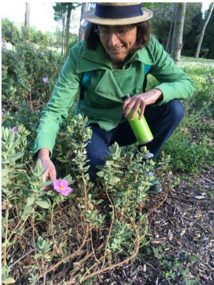
Attention, fleur fragile : le ciste cotonneux.